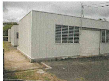
Lycée La jetée François