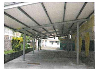
Ecole Primaire Fond Lahaye