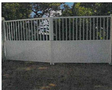
Portail à 2 battants