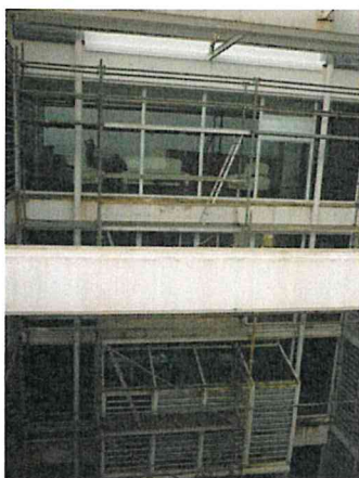
Solin au Rectorat