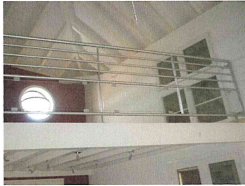
Garde-corps galvanisé barreaudage et vitre