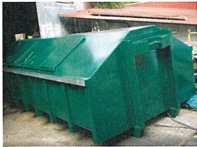
Caisson fermé 18m 3