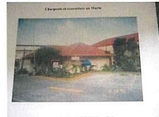
Crédit Mutuel Marin