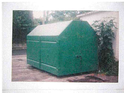
Caisson fermé de 6m 3