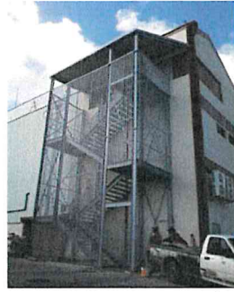
Escalier droit Annette/Marin