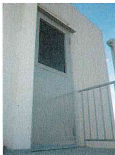
Porte 2ble face et vitrée