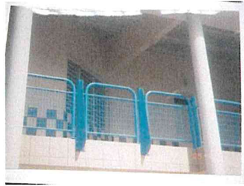
Garde-corps école primaire