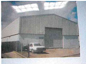
Charpente 100m 2 Trinité