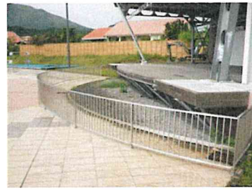
Garde-corps inox M-Rouge