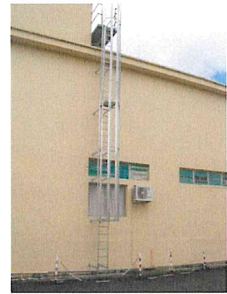
Echelle à crinoline