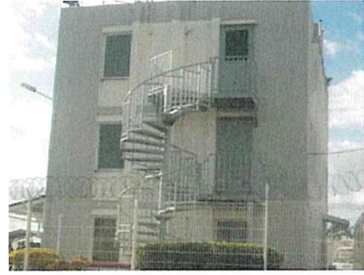
Escalier Hélicoïdal Antilles Gaz