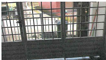
Porte à 3 vantaux