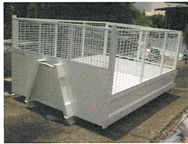
Benne ouverte amovible avec ridelles abattables