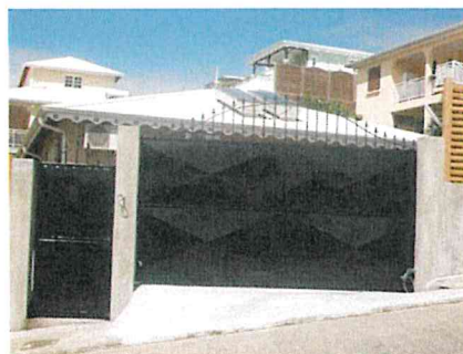
Porte et portillon en pte diamant