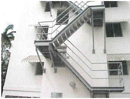
Escalier suspendu à Didier