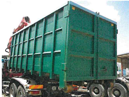
Benne de 30m 3 adaptable aux camions