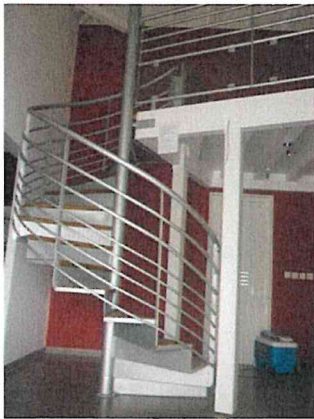
Escalier galvanisé et marche en bois chez un particulier