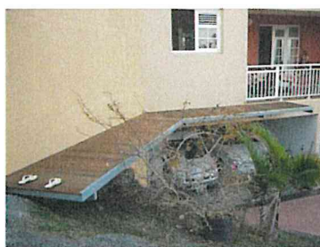
Passerelle chez particulier

Les principales réalisations publiques et parapubliques de ces 3 dernières années sont les suivantes :